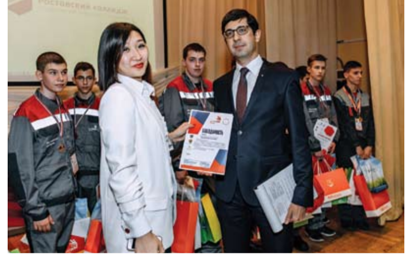
Церемония награждения победителей Регионального чемпионата «Молодые профессионалы (Ворлдскиллс Россия)» Ростовской области 2019