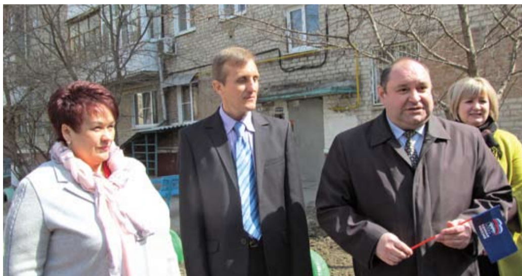
Знакомство с инициативами ТОС «Вектор развития»

– Заседание Палаты провели в Волгодонске, потому что здесь сложилась очень интересная практика работы ТОСов. Есть на что посмотреть, какой опыт перенять. В Ростовской области в настоящее время действует около тысячи ТОС. Совместное обсуждение показало, что система действует, она помогает решать многие проблемы. Текущие вопросы ТОСы решают вместе с Администрациями, занимаются благоустройством, помогают ветеранам и инвалидам. В Волгодонске живут очень инициативные и позитивные люди, активно работают депутаты. Сегодня на областном уровне прорабатывается вопрос стимулирования ТОСов, в ближайшее время будет подготовлен типовой нормативно-правовой акт, который поможет в регистрации органа как юридического лица. Конечно, во главе угла остается активность самих жителей и их желание улучшить свою жизнь. Убежден, что это движение будет развиваться и оказывать все большее влияние на развитие районов.