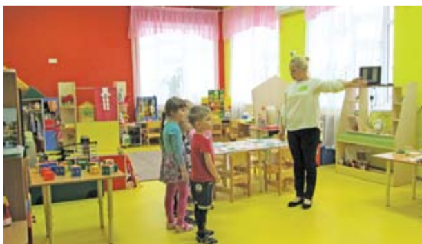
Детский сад «Садко»